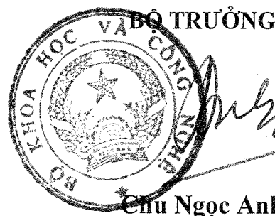
Chu Ngọc Anh